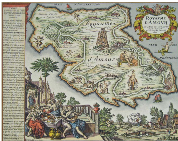
« Le Royaume d'Amour en l'Isle de Cypre », carte décrite par le Sieur Tristan Lhermite, 1650

Au-delà de l'étude monographique, la question du style tristanien vise également à nourrir la réflexion sur la notion de style individuel qui apparaît généralement peu pertinente pour l'Ancien Régime, prise entre style d'époque et style de genre, mais qui mérite cependant d'être interrogée et réhabilitée, à l'épreuve de la production d'un tel polygraphe.